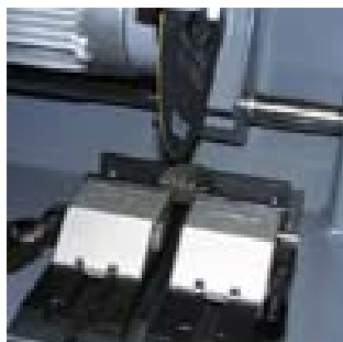
Ejemplos de Mordazas